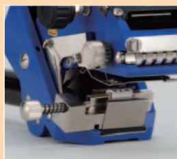
■ MBS-10 CTマークバンド用具