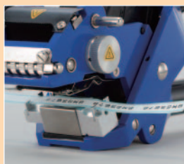
■ M52-17 マーカ―ラベル用具