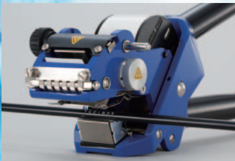
電線／コントロールケーブル