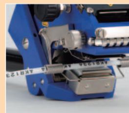
■ チューブガイド ガイド内径 4・6・7・8 10.5mm