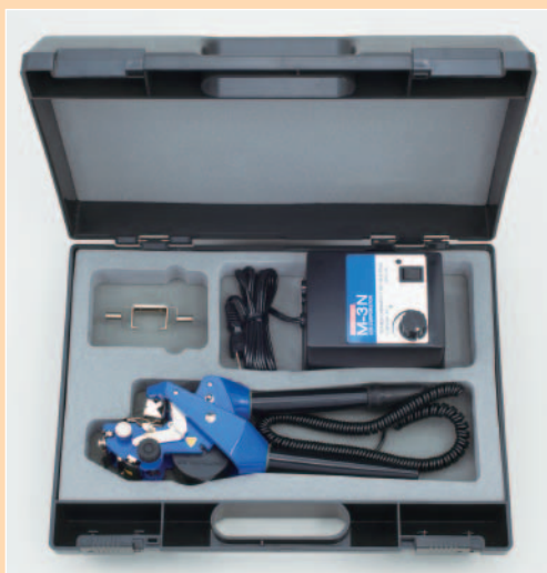
チューブガイド(ガイド内径φ5mm) : 1個付属