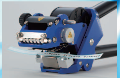
マーカ―ラベル M52-17(オプション治具)